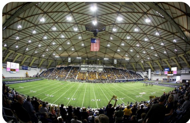
北亚天幕体育馆 Sky Dome 全美最大木质橄榄球馆，建于1973年