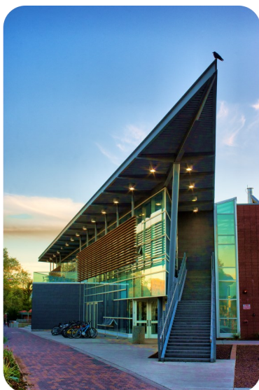
北亚学生活动中心 University Union