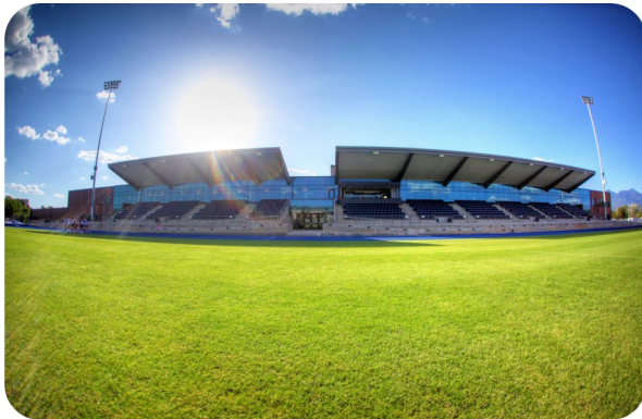
健康学习中心 (Health and Learning Center)

* 以上仅供参。如有变化，学生需在申请2+3项目时需咨询北亚研究生学院或参照最新院系入学要求。