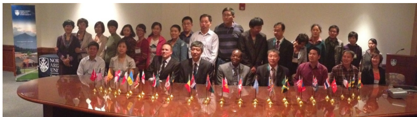
(石家庄经济学院教师培训团结业典礼)

2012年，与以往以一学期或一年为基础的个人教师访问有所不同，国际教育中心中国项目部首次启动了中国短期教师团队培训项目。9月20日，来自石家庄经